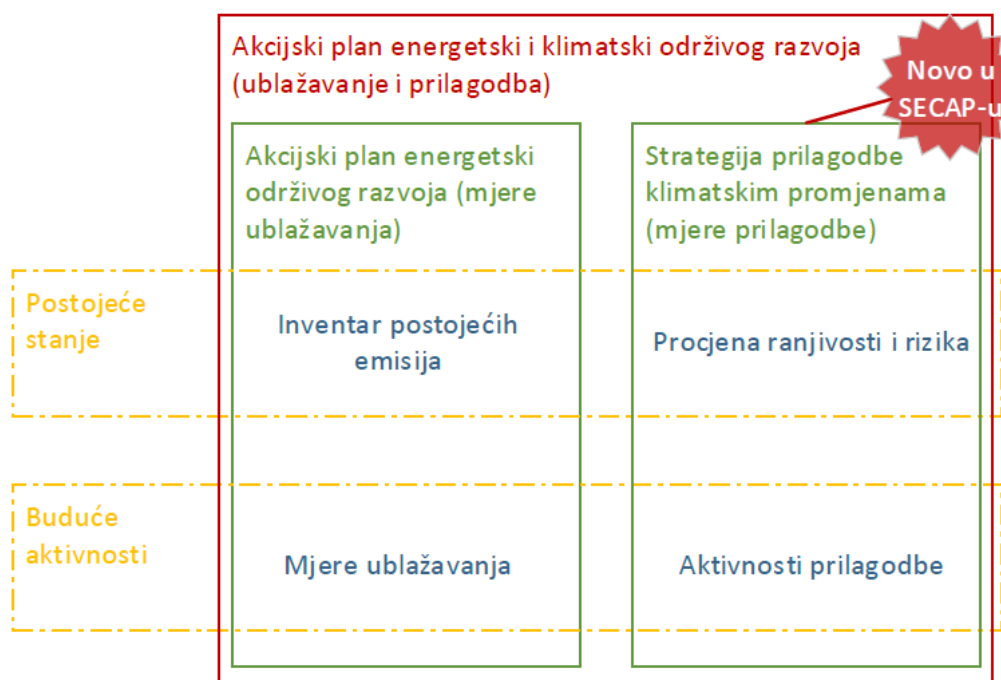
Slika 1: Prikaz sadržaja Akcijskog plana energetske i klimatske održivosti razvoja (tzv. SECAP-a)

Strategija prilagodbe klimatskim promjenama može biti dio Akcijskog plana energetske i klimatske održivosti razvoja grada i/ili se može razviti i uključiti u zaseban planski dokument. Ovaj odvažan politički angažman označava početak dugotrajnog postupka, a gradovi su obvezni izvještavati o napretku provedbe planova svake dvije godine.